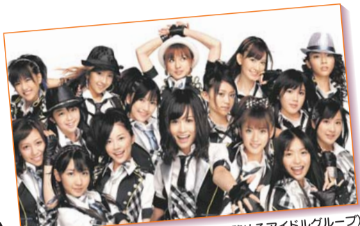
AKB48(秋元康氏が総合プロデュースを務めるアイドルグループ)

あのAKB48のライブパフォーマンスを生で体感。歌あり、トークありのステージは彼女たちの魅力がいっぱいです。ふだんは聞けないドライブにまつわる理想や思い出など、モーターショーならではのスペシャルトークにもご期待ください!