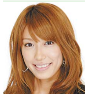
歌手・タレント 里田まいさん 1984年北海道生まれ。2002年に「カントリー娘。」に加入。その後、TV番組を中心に歌手・タレントとして多方面で活躍。